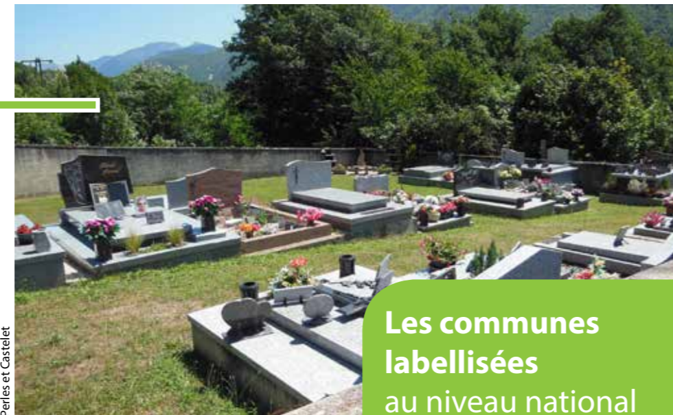
Perles et Castelet

Elle implique également une évolution dans les travaux d'entretien des espaces par l'intégration de techniques alternatives à l'arrosage et au désherbage : recours au paillage (limitation des arrosages et de la végétation spontanée), choix judicieux de la palette végétale (essences locales et/ou adaptée aux périodes de sécheresse, plantes