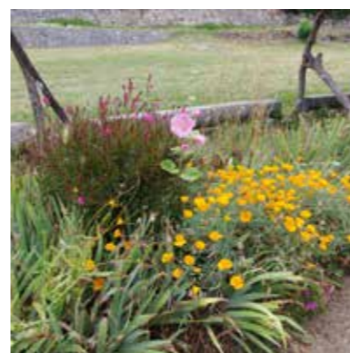
Suc et Sentenac