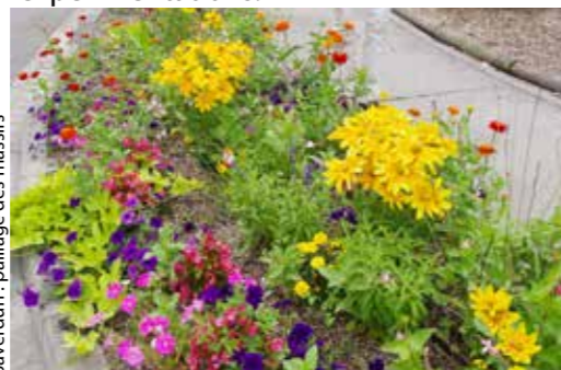
Saverdun : paillage des massifs

Quelques exemples en Ariège d'enherbement des cimetières montrent que des communes se sont déjà lancées dans ces expérimentations.